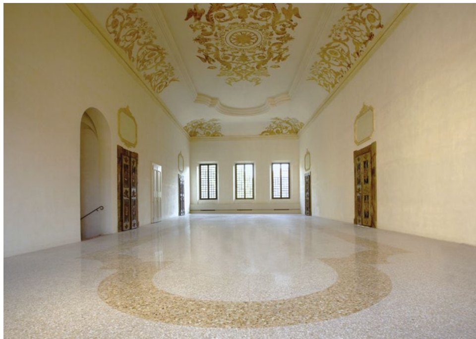
Vista del Salone d'onore